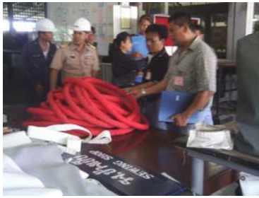
เชือกชักจุดๆที่ห่มผ้าเสร็จแล้วรอการแทงเชือกๆ