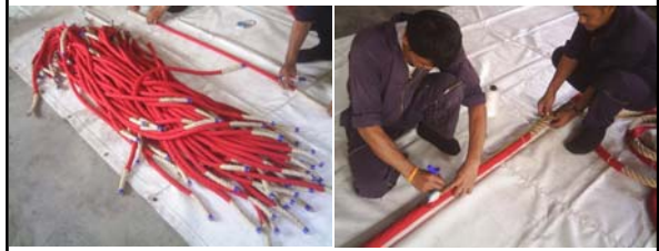
เชือกห้วงคล้องใหญ่ที่ห่มผ้าเสร็จแล้ว