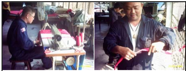
เย็บผ้าห่มเชือกห้วงคล้องใหญ่