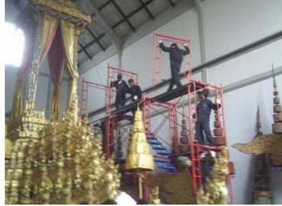
๑๔ ก.พ. ๕๑ ติดตั้งนั่งร้านเพื่อซ่อมราชรถที่โรงเก็บราชรถ พิพิธภัณฑสถานแห่งชาติ