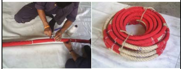
ถร้อยผ้าห่มเชือกๆตามแหน่งแทงเชือกห้วงคล้องใหญ่