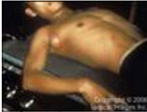
ภาพโรคของต่อมน้ำเหลือง (Bubonic plague)