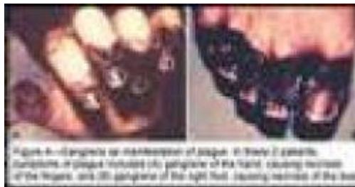
ภาพโรคนิดโลหิตเป็นพิษ