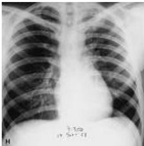
ภาพโรคปอดบวม (Pneumonic plague)