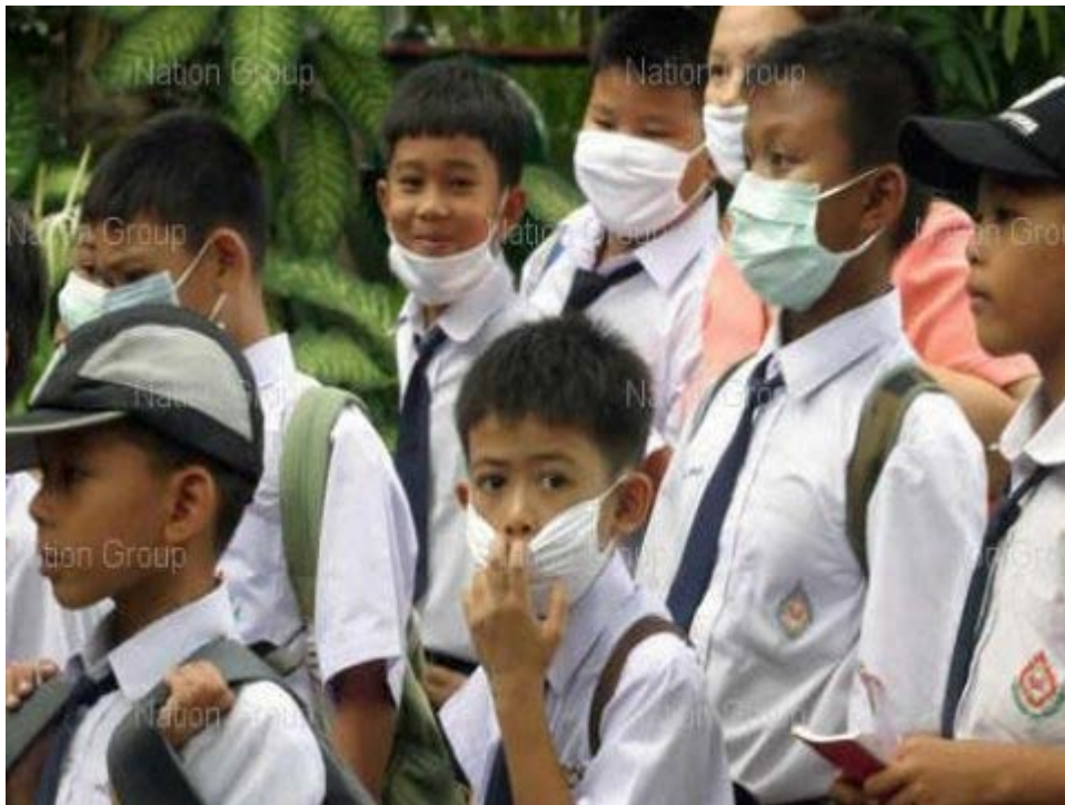
สธ. ชี้อย่าตื่นภาพโรคปอด-จีนตายแล้ว3

จีนพบเหยื่อภาพโรคปอดเสียชีวิตเป็นรายที่ 3 ด้านสธ.ออกหนังสือแจ้งปชช.อย่า ตระหนก ระบุ ภาพโรคหายจากไทยตั้งแต่ปี 2495