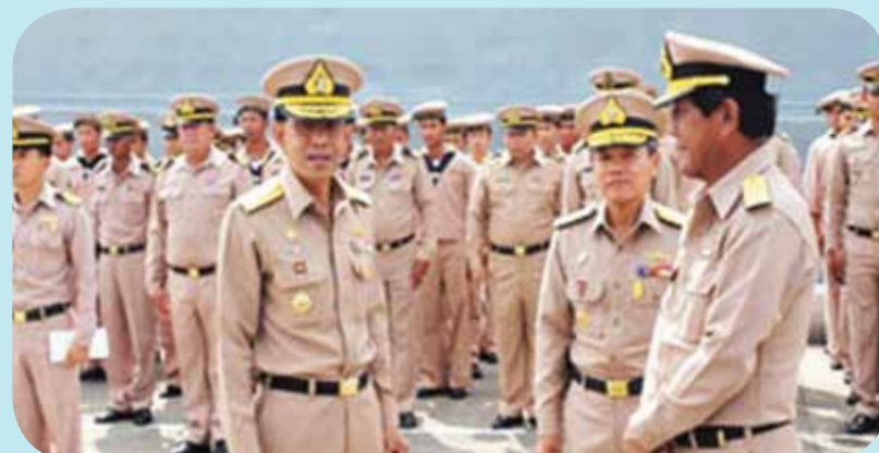
พลเรือเอก มนต์ ทองพูล ผู้บัญชาการกองเรือยุทธการ และคณะเดินทางไปตรวจเยี่ยมกำลังพลที่ปฏิบัติราชการในพื้นที่ภาคใต้ เพื่อรับทราบปัญหา อุปสรรค ข้อขัดข้อง ข้อเสนอแนะในการปฏิบัติงานของหน่วย รวมทั้งเป็นการบำรุงขวัญและกำลังใจแก่กำลังพล เมื่อวันที่ ๙ มกราคม ๒๕๕๕