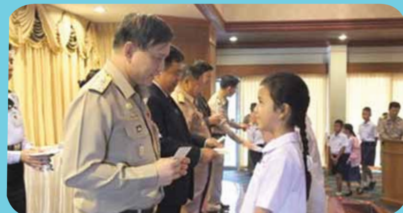
พลเรือเอก อมรเทพ ณ บางช้าง ผู้ช่วยผู้บัญชาการทหารเรือ เป็นประธานในพิธีมอบทุนการศึกษาบุตรข้าราชการและลูกจ้างกองทัพเรือ ประจำปีการศึกษา ๒๕๕๔ ณ นันทอุทยานสโมสร เมื่อวันที่ ๒๖ ธันวาคม ๒๕๕๔