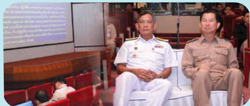
พลเรือเอก อภิวัฒน์ ศรีวรรธนะ ประธานคณะที่ปรึกษากองทัพเรือ ในฐานะรองผู้อำนวยการกองการฝึกกองทัพเรือ๕๕/หัวหน้าส่วนควบคุมและประเมินผลการฝึกกองอำนาจการฝึกกองทัพเรือ ประจำปี ๒๕๕๕ ตรวจเยี่ยมการจัดกิจกรรมในการฝึกกองทัพเรือประจำปี ๒๕๕๕ โดยมี พลเรือโท อภิชาย ฟุ้งรัตดา เจ้ากรมยุทธศึกษาทหารเรือ ต้อนรับ ณ อาคารสถาบันวิชาการทหารเรือชั้นสูง กรมยุทธศึกษาทหารเรือ เมื่อวันที่ ๑๑ มกราคม ๒๕๕๕