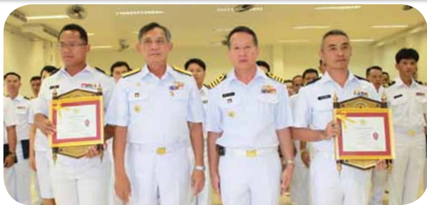
พลเรือโท อภิชาย พงษ์รัตดา เจ้ากรมยุทธศึกษาทหารเรือ เป็นประธานในพิธีมอบประกาศนียบัตร ใบประกาศเกียรติคุณและโล่เกียรติยศ แก่ผู้สำเร็จการศึกษาอบรม หลักสูตรพันจ่านักเรียนและนักเรียนพันจ่า รุ่นที่ ๑/๒๕๕๕ พื้นที่พุทธมณฑล ณ ห้องเรียนรวม โรงเรียนพันจ่า กรมยุทธศึกษาทหารเรือ เมื่อวันที่ ๑๓ มกราคม ๒๕๕๕