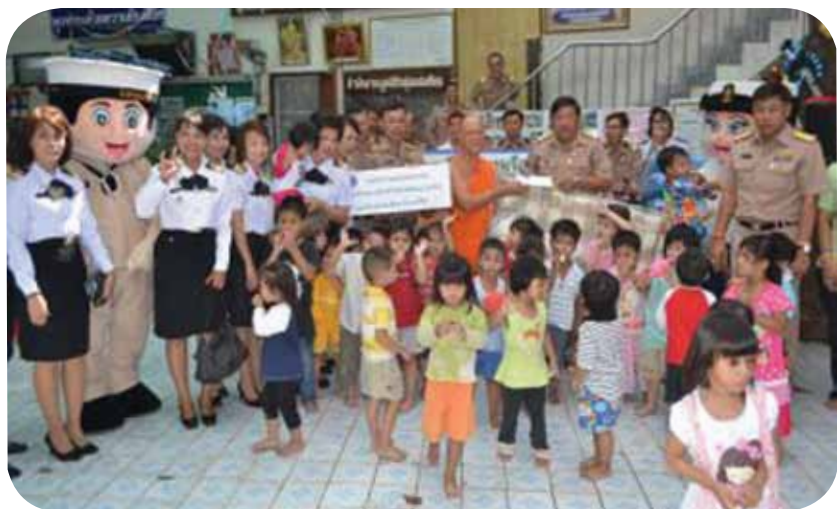
พลเรือตรี ประพฤติพร อักษรมัต เจ้ากรมกิจการพลเรือนทหารเรือ ข้าราชการกรมกิจการพลเรือนทหารเรือ จัดเลี้ยงอาหารกลางวันและบริจาคเงิน สิ่งของเครื่องใช้ให้กับเด็กก่อนวัยเรียน ณ มูลนิธิกลุ่มเสียงเทียน วัดบางไส้ไก่ เมื่อวันที่ ๔ มกราคม ๒๕๕๕