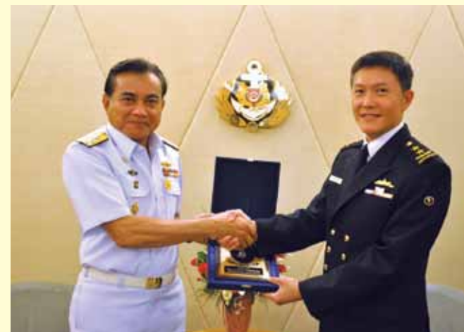
• เยี่ยมคำนับ Dr.Ng Eng Hen รัฐมนตรีว่าการกระทรวงกลาโหมสิงคโปร์