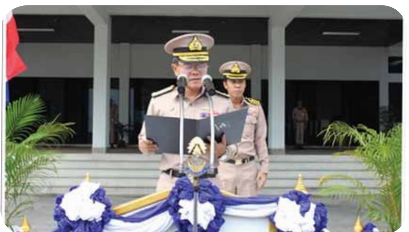
พลเรือโท ทวีป สุขพินิจ ผู้บัญชาการ ทัพเรือภาคที่ ๒ กล่าวให้โอวาทและอวยพรปีใหม่เนื่องในโอกาสวันขึ้นปีใหม่ ประจำปี ๒๕๕๕ แก่ข้าราชการและลูกจ้าง ในพื้นที่ ทัพเรือภาคที่ ๒ ณ บริเวณหน้ากองบัญชาการทัพเรือภาคที่ ๒ เมื่อวันที่ ๒๙ ธันวาคม ๒๕๕๔