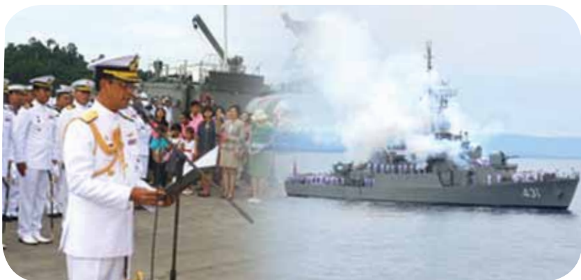
พลเรือโท ธีรธร ขจิตสุวรรณ ผู้บัญชาการทัพเรือภาคที่ ๓ จัดพิธียิงสลุตหลวงในวโรกาสมหามงคลเฉลิมพระชนมพรรษา ๘๔ พรรษา ๕ ธันวาคม ณ บริเวณเขาน้ำยักษ์ฐานทัพเรือพังงา ทัพเรือภาคที่ ๓ อำเภอท้ายเหมือง จังหวัดพังงา เมื่อวันที่ ๕ ธันวาคม ๒๕๕๔