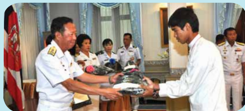
พลเรือเอก วีรพล กิจสมบัติ รองผู้บัญชาการทหารเรือ มอบของแก่คณะเยาวชนในพื้นที่ปฏิบัติงานของหน่วยเฉพาะกิจนาวิกโยธิน ตามโครงการรวมไทยใจเป็นหนึ่ง ประจำปี ๒๕๕๕ ในโอกาสที่เดินทางไปทัศนศึกษาออกสถานที่ เยี่ยมชมพระราชวังเดิม ณ ห้องรับรอง กองบัญชาการกองทัพเรือ พระราชวังเดิม เขตบางกอกใหญ่ กรุงเทพมหานคร เมื่อวันที่ ๑๙ ธันวาคม ๒๕๕๔