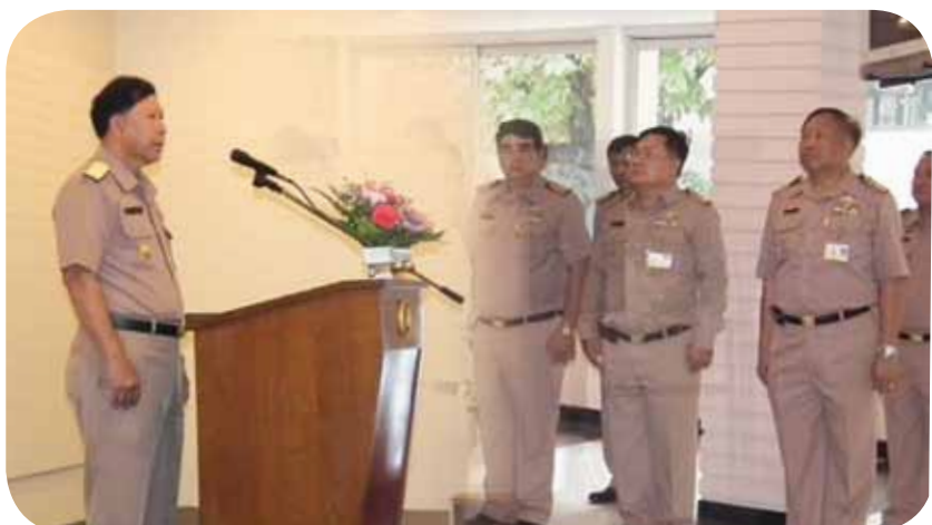
พลเรือตรี ปพนภพ สุวรรณวาทีน เจ้ากรมช่างโยธาทหารเรือ เป็นประธานในพิธีเปิดหลักสูตรอาชีพเพื่อเลื่อนฐานะขั้นพันจ่าเอก และ จ่าเอก ประจำปี ๒๕๕๕ มีนักเรียนเข้ารับการอบรม จำนวน ๓๔ นาย เมื่อวันที่ ๕ ธันวาคม ๒๕๕๔