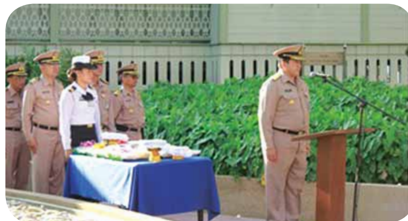
พลเรือตรี พลเดช เจริญพูล เจ้ากรมการสื่อสารและเทคโนโลยีสารสนเทศทหารเรือ เป็นประธานมอบเงินช่วยเหลือข้าราชการที่ประสบอุทกภัยและมอบของขวัญปีใหม่ให้แก่ข้าราชการกรมการสื่อสารและเทคโนโลยีสารสนเทศทหารเรือ ณ บริเวณหน้ากรมการสื่อสารและเทคโนโลยีสารสนเทศทหารเรือ พระราชวังเดิม กรุงเทพมหานคร เมื่อวันที่ ๒๙ ธันวาคม ๒๕๕๔