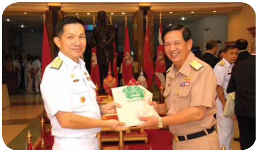
พลเรือโท มานิตย์ สุนนาคำ เจ้ากรมอู่ทหารเรือ ต้อนรับ พลเรือเอก พลวัฒน์ สิโรตม ที่ปรึกษาพิเศษกองทัพเรือ เนื่องในโอกาสวันคล้ายวันสถาปนากรมอู่ทหารเรือ ครบ ๑๒๒ ปี ณ กองบัญชาการกรมอู่ทหารเรือ เมื่อวันที่ ๙ มกราคม ๒๕๕๕