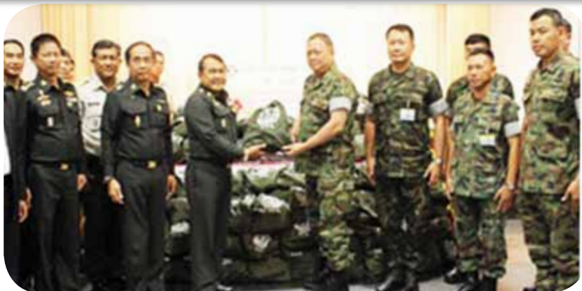
พลเรือโท พงศ์ศักดิ์ ภูริโรจน์ ผู้บัญชาการหน่วยบัญชาการนาวิกโยธิน รับมอบธงของขวัญจาก องค์การทหารผ่านศึก ในพระบรมราชูปถัมภ์ ณ ห้องประชุม กองบัญชาการหน่วยบัญชาการนาวิกโยธิน ๑ หน่วยบัญชาการนาวิกโยธิน ค่ายกรมหลวงชุมพร อำเภอสัตหีบ จังหวัดชลบุรี เมื่อวันที่ ๖ มกราคม ๒๕๕๕