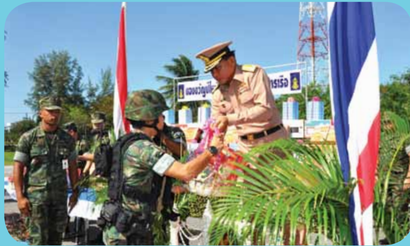
พลเรือเอก สุรศักดิ์ หุ่นเรืองรมย์ ผู้บัญชาการทหารเรือ และคณะ เดินทางไปตรวจเยี่ยมหน่วยในพื้นที่ภาคใต้เพื่อเยี่ยมบำรุงขวัญและกำลังใจแก่กำลังพล เมื่อวันที่ ๕ มกราคม ๒๕๕๕