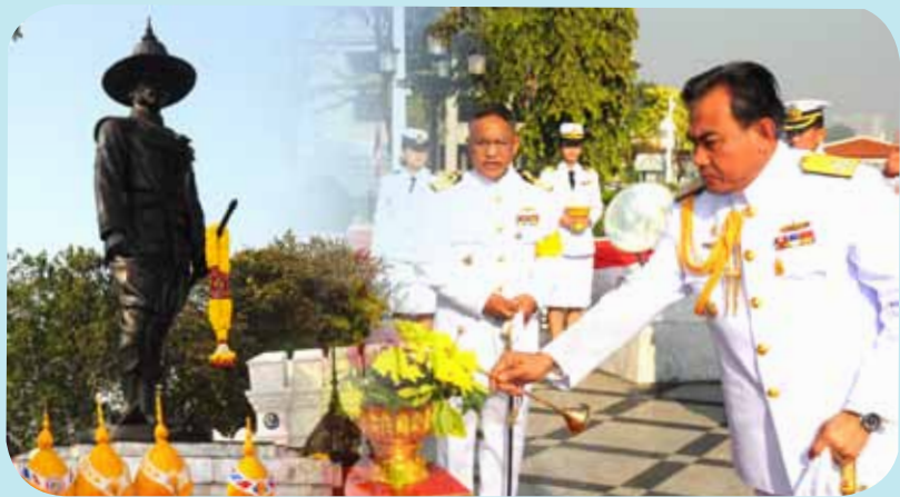
พลเรือเอก สุรศักดิ์ หุ่นเรืองรมย์ ผู้บัญชาการทหารเรือ เป็นประธานในพิธีวางพานพุ่มถวายพระบรมราชานุสาวรีย์ สมเด็จพระเจ้าตากสินมหาราช โดยมีนายทหารชั้นผู้ใหญ่ของกองทัพเรือเข้าร่วมในพิธี ณ บริเวณท่าเทียบเรือ กองบัญชาการกองทัพเรือ พระราชวังเดิม กรุงเทพมหานคร เมื่อวันที่ ๒๔ ธันวาคม ๒๕๕๕