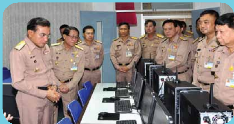
พลเรือเอก สุรศักดิ์ หุ่นเรืองรมย์ ผู้บัญชาการทหารเรือ เป็นประธานในพิธีเปิดศูนย์ข้อมูลข่าวสารทางทะเลศูนย์ปฏิบัติการกองทัพเรือ ณ ห้องประชุมศูนย์ปฏิบัติการกองทัพเรือ เมื่อวันที่ ๙ มกราคม ๒๕๕๕