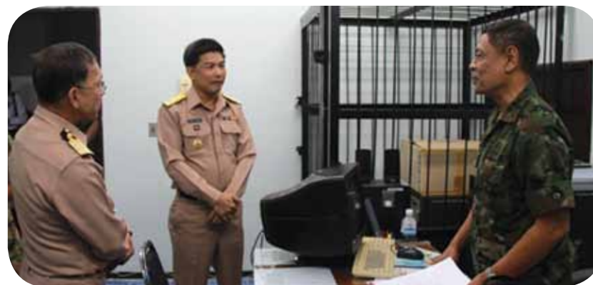
พลเรือตรี จิรพัฒน์ ปานสกุน เจ้ากรมการเงินทหารเรือ พร้อมคณะเดินทางไปตรวจเยี่ยมกองการเงิน กองบัญชาการหน่วยเรือรักษาความสงบเรียบร้อยตามลำแม่น้ำโขง เพื่อรับฟังข้อขัดข้องและให้ข้อเสนอแนะในการปฏิบัติงานด้านการเงิน รวมทั้งเป็นขวัญกำลังใจแก่กำลังพล ณ กองบังคับการหน่วยเรือรักษาความสงบเรียบร้อยตามลำแม่น้ำโขง จังหวัดนครพนม เมื่อวันที่ ๑๔ ธันวาคม ๒๕๕๔